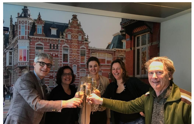
Afbeelding : Viering van de oprichting van Stichting Sparkling Plastic

Een andere manier om de organisatie te verstevigen is natuurlijk om de werkplaats zelf draaiende te krijgen door de benodigde machines en materialen aan te schaffen of