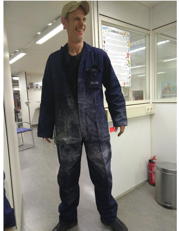
Afbeelding: Met plezier aan het werk!

Een belangrijk onderdeel in de doelstelling van Sparkling Plastic is om studenten (jongeren) op een creatieve te betrekken bij onze werkplaats en het plasticvraagstuk. Voor dit onderdeel van de stichting mochten de initiatiefnemers een bijdrage ontvangen van het Prins Bernhard Cultuurfonds van €10.000.